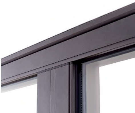
► Design droit et moderne (vue extérieure).