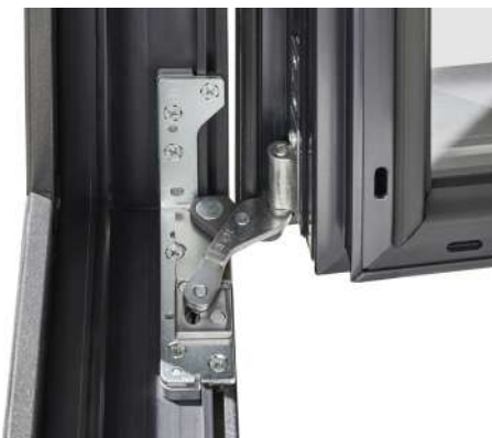
► Charnières invisibles disponibles en option afin d'épurer au maximum votre menuiserie.