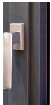
► Poignée contemporaine. Poignée centrée en option.