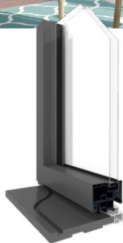
TABLEAU DE REFERENCEMENT DE LA GAMME DE COULISSANT MULTIMATÉRIAUX SYMA.S

*Performances maximales atteignables sur la gamme