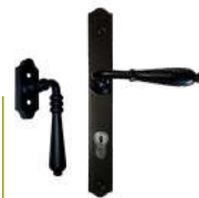
Colbert et Nevers Noir