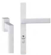
PURE blanche Poignée Secustik®