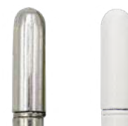
Entaillé de base Bichromatée (en base) ou blanche (option)