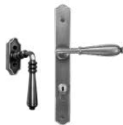
Colbert et Nevers Patiné argent