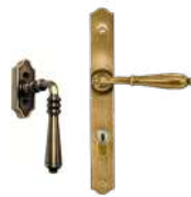
Colbert et Nevers Laiton vieilli