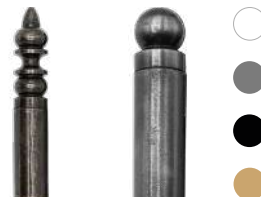
Entaillé de style Turlupet ou boule noir, blanche, patiné argent, bronze