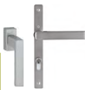
PURE ton titane Poignée Secustik®