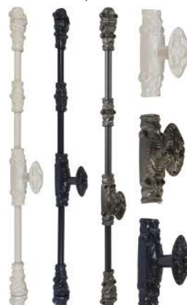
Blanc, noir et vernis époxy