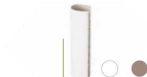
Cache ferrure oscillo battant Blanc, aspect Alu, laiton ou noir